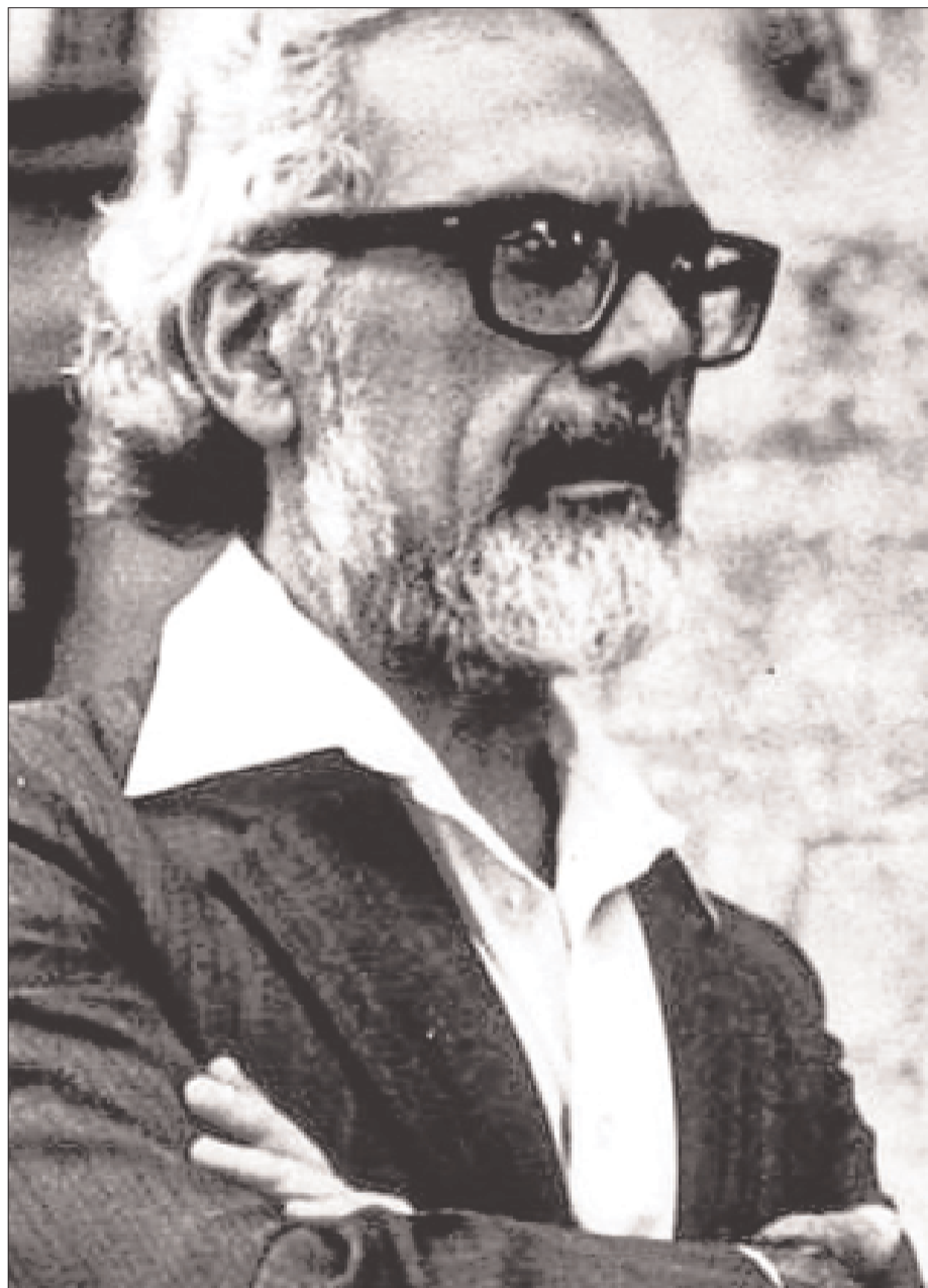
El narrador argentino Antonio Di Benedetto, fallecido en 1986.

El Aleph publica en un único volumen las tres grandes novelas del escritor argentino. Admirado por Borges, Cortázar o Bolaño, Di Benedetto fue principio y fin en sí mismo de un estilo único, de una estación literaria propia