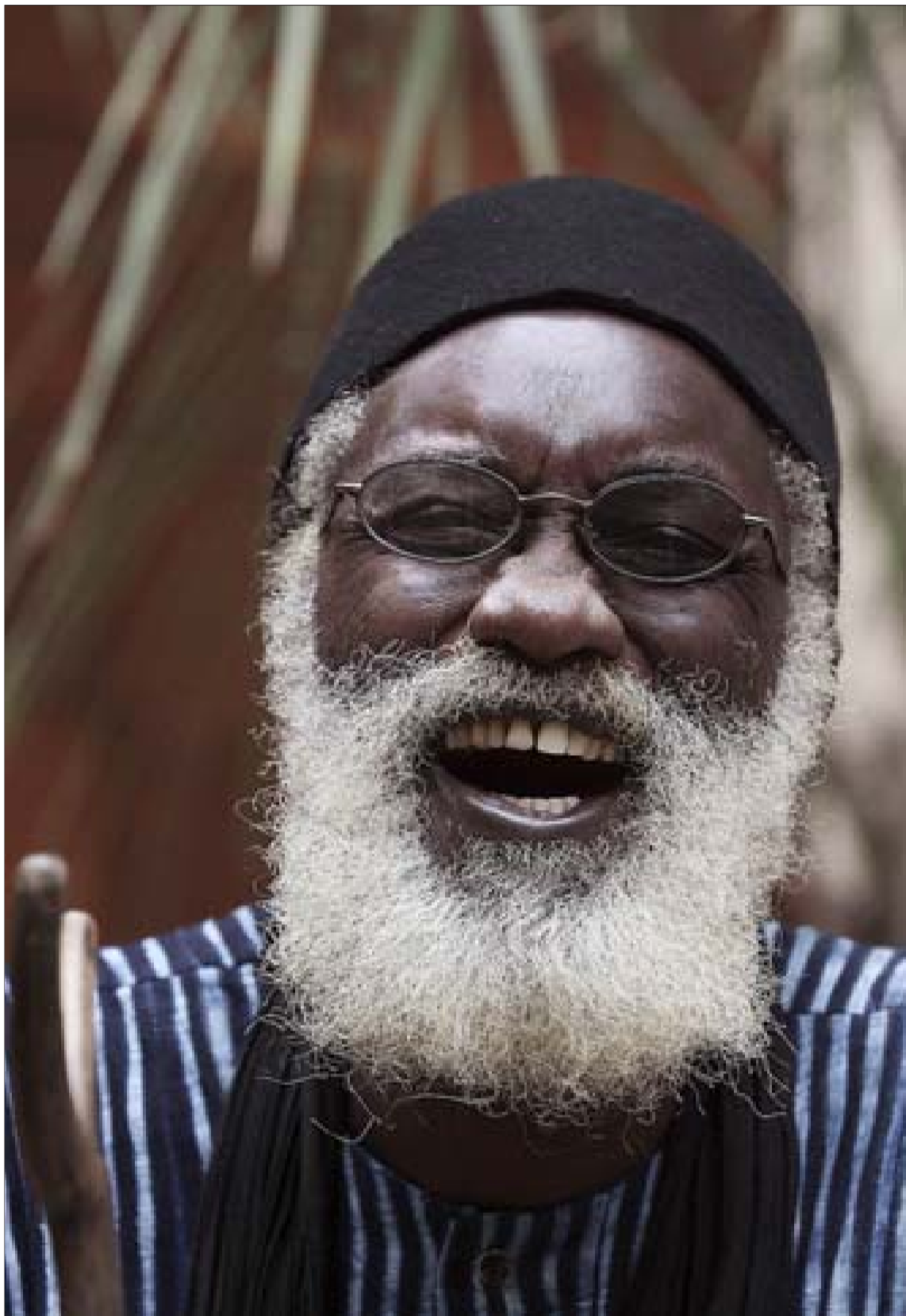
El escritor senegalés Abasse Ndione, autor de 'Ramata' y 'La vida en espiral', en Madrid.

Sobre la arriesgada emigración a la que se ven forzados muchos de sus compatriotas, capaces de